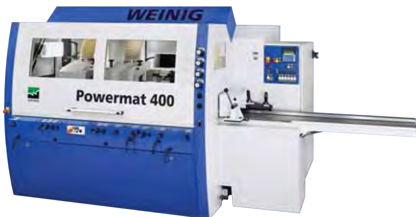
Powermat 400: высокопроизводительная базовая модель в линейке продольно-фрезерных станков фирмы WEINIG

деля и благодаря этому свободна от ограниченного числа инструментов стандартных установок. Обрабатывающий центр Conturex считается перспективным решением для всех известных оконных систем на гибком современном оконном производстве. Во время демонстраций посетители могут увидеть на практике все экспонируемое оборудование. Здесь же они смогут получить компетентную консультацию у специалистов российских представительств фирмы WEINIG и экспертов немецких фирм-производителей.