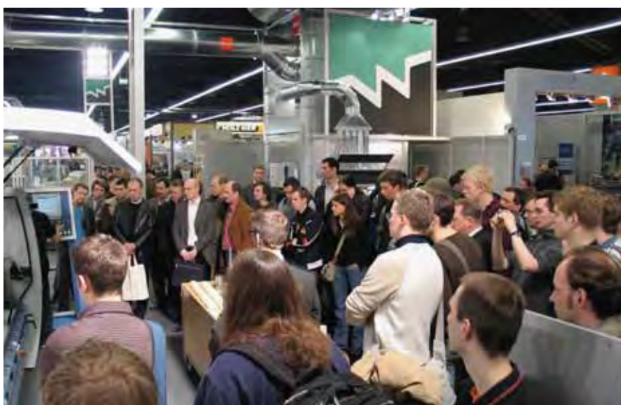
Всегда в центре внимания: стенд WEINIG — «магнит» для посетителей на всех международных выставках

торым характеризуются более тяжелые станки. Система инструментов PowerLock, позволяющая максимально сократить время на замену инструмента и система управления PowerCom делают его одним из высокопроизводительных станков для организации производства по принципу «точно в срок». Свой опыт в разработке системных решений фирма WEINIG подчеркнет с помощью двух примеров из области вспомогательного оборудования. Автоматический заточный станок Rondamat 960, предназначенный для изготовления и последующей заточки ножей из бланкет из быстрорежущей спецстали, стеллита или твердого сплава, позволяет заказчику при любом заказе быть независимым от поставщиков. Система OptiControl для оптического измерения инструмента наилучшим образом дополняет высокоэффективную подготовку инструмента к работе. Также в Москве будут продемонстрированы два всемирно известных успешных решения WEINIG по продольному раскрою и торцовке. Многопильный станок ProfiRip KM 310 доказывает свою уникальность благодаря высокому удобству обслуживания и лучшей самокупаемости. При необходимости можно увеличить выход продукции за счет ряда опций для оптимизации. Автоматический торцовочный станок с толкателем OptiCut S 50 делает доступными преимущества продольного раскроя и для более мелких и средних предприятий. В сравнении с ручной торцовочной пилой на нем можно распиливать в 4 раза больше древе-