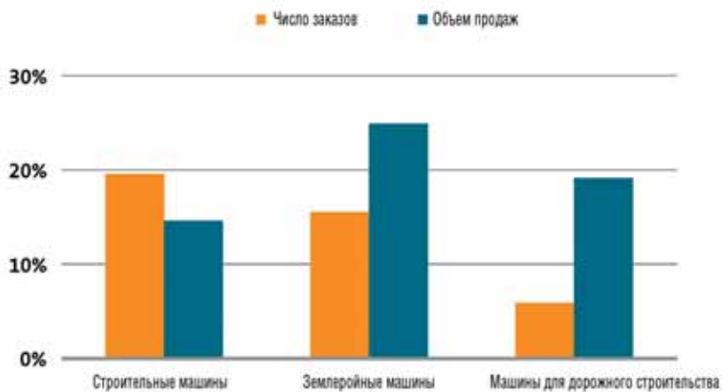
Рост числа заказов и объемов продаж машин и оборудования для строительства в 2011 году

Однако наибольшую часть заказов на машины и оборудование для строительства и производства строительных материалов в 2011 году, как и прежде, составили заказы из других стран. Как и ранее, ключевыми