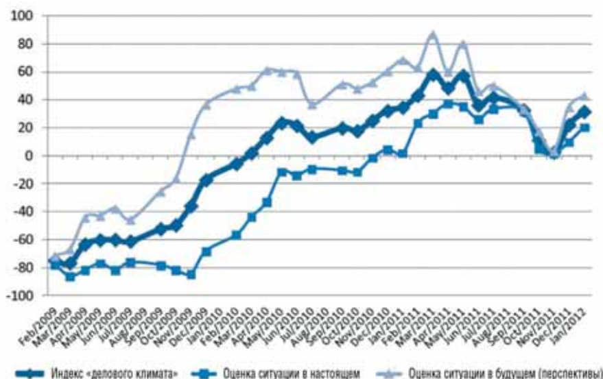
Динамика индекса «делового климата» по сводной оценке европейских производителей