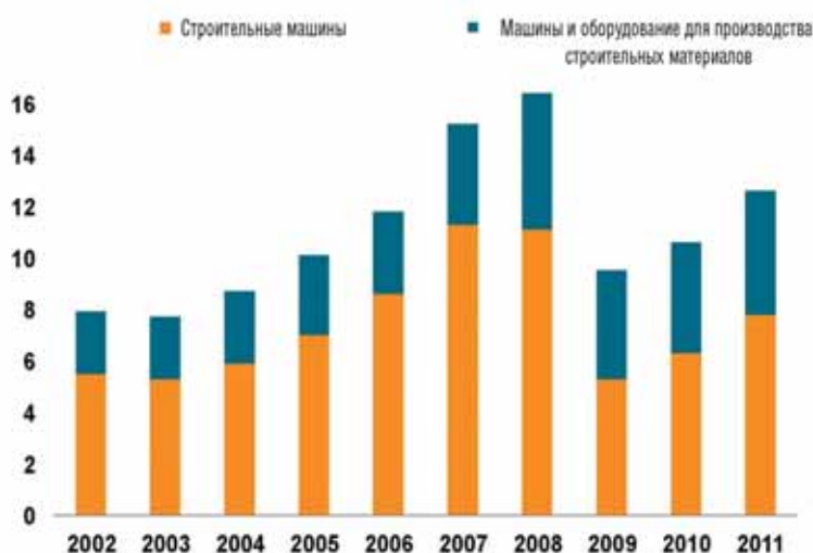
Динамика товарооборота германских производителей машин и оборудования для строительства и производства строительных материалов (объемы продаж)