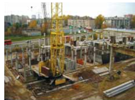
Ход строительства 21.07.2007