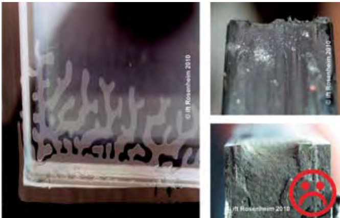
«Червоточина» многослойного стекла (триплекса)

Ift Розенхайм признан во всей Европе как институт проверки, контроля и сертификации, а также аккредитирован на международном уровне согласно немецкому промышленному стандарту DIN EN ISO/IEC 17025. В центре его внимания находятся практическая, комплексная и быстрая проверка всех характеристик окон, фасадов, дверей, стекла и стройматериалов. Цель объединения Розенхайм – это непрерывное улучшение качества продуктов, конструкций и технологий, а также работы в области нормирования и исследования. Сертификация института ift обеспечивает общеевропейское признание. Институт оконных технологий ift берёт на себя ответственность за передачу полученных знаний. Являясь независимой организацией, Розенхайм имеет особый статус в средствах массовой информации, и его публикации определяют современный уровень техники.