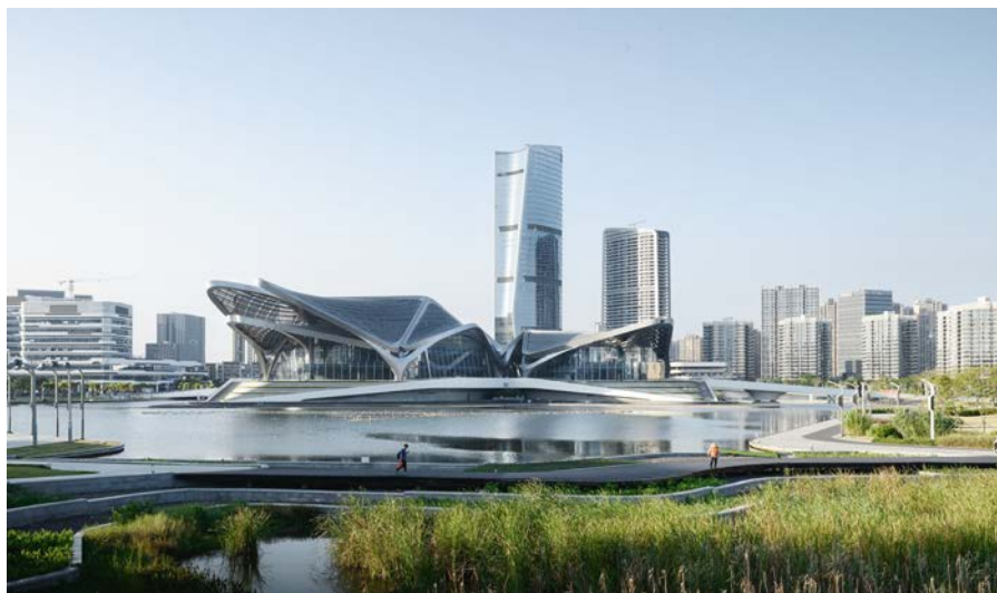
Общественный центр искусств Чжухай Цзиньвань

Учитывая, что здание расположено в субтропическом климате, в прибрежной зоне Южного Китая, двойное остекление оболочки здания оптимизировано в отношении тепловых характеристик и защищено решетчатым навесом крыши, который включает перфорированные алюминиевые панели для внешней защиты от солнца. Перфорация панелей различается по размеру, чтобы обеспечить различную степень солнечного света во внутренних помещениях Центра в соответствии с проектными требованиями, ориентацией и уровнем солнечной радиации. Ночью этот навес на крыше заливают Центром мягким отраженным светом.