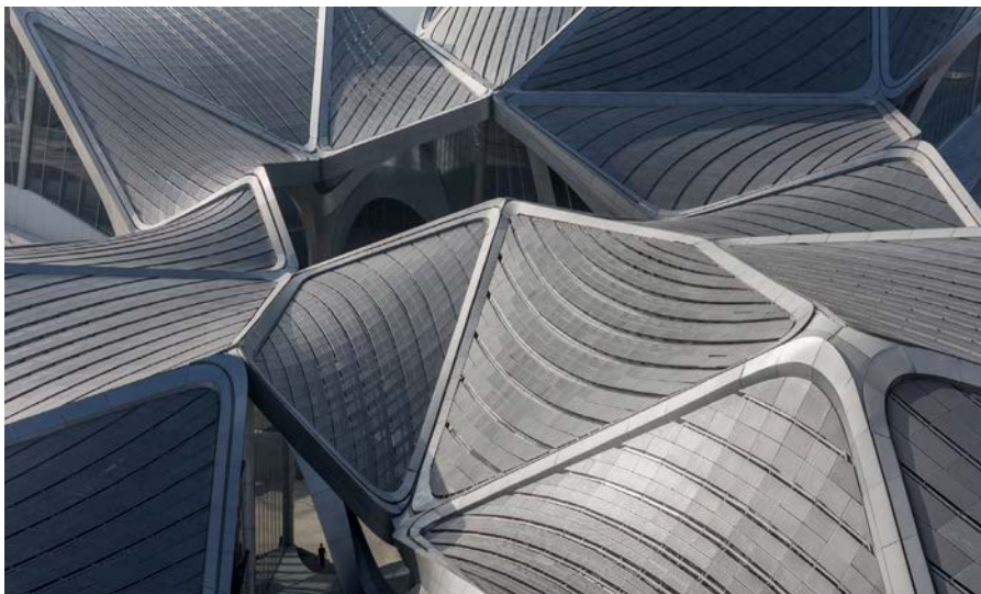
Фрагмент кровли Общественного центра искусств Чжухай Цзиньвань