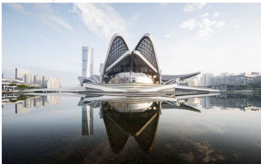
Общественный центр искусств Чжухай Цзиньвань