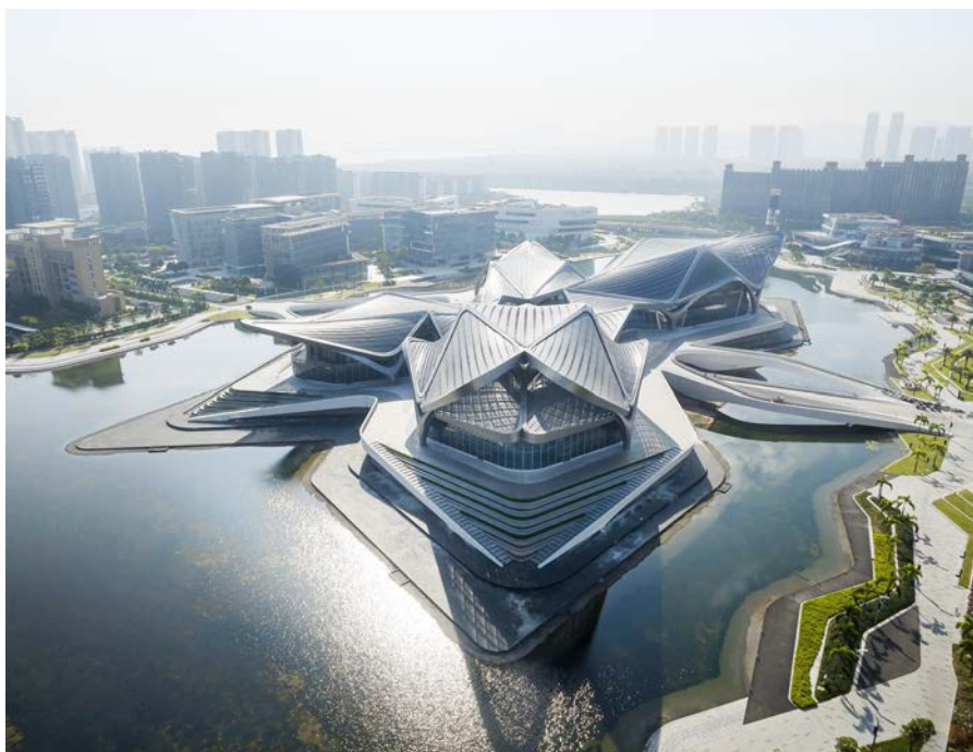
Общественный центр искусств Чжухай Цзиньвань

Общественный центр искусств Чжухай Цзиньвань включает четыре культурных учреждения: Большой театр на 1200 мест, Многофункци-