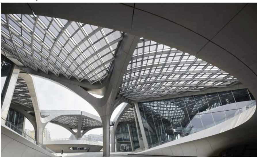
Интерьеры Общественного центра искусств Чжухай Цзиньвань