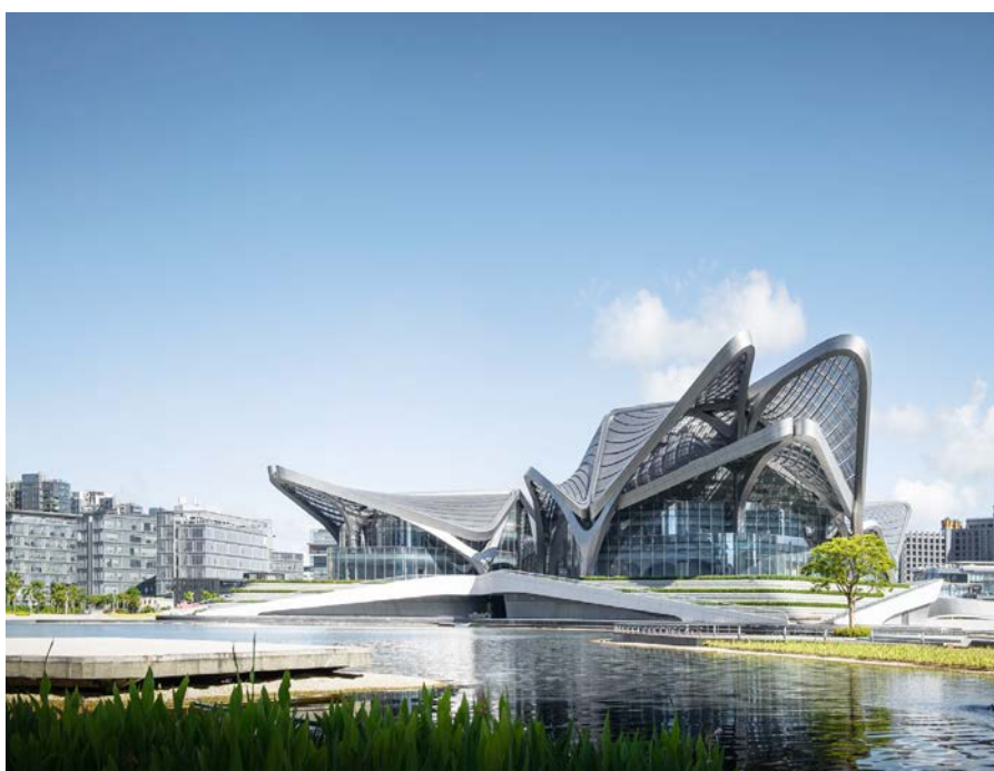
Общественный центр искусств Чжухай Цзиньвань